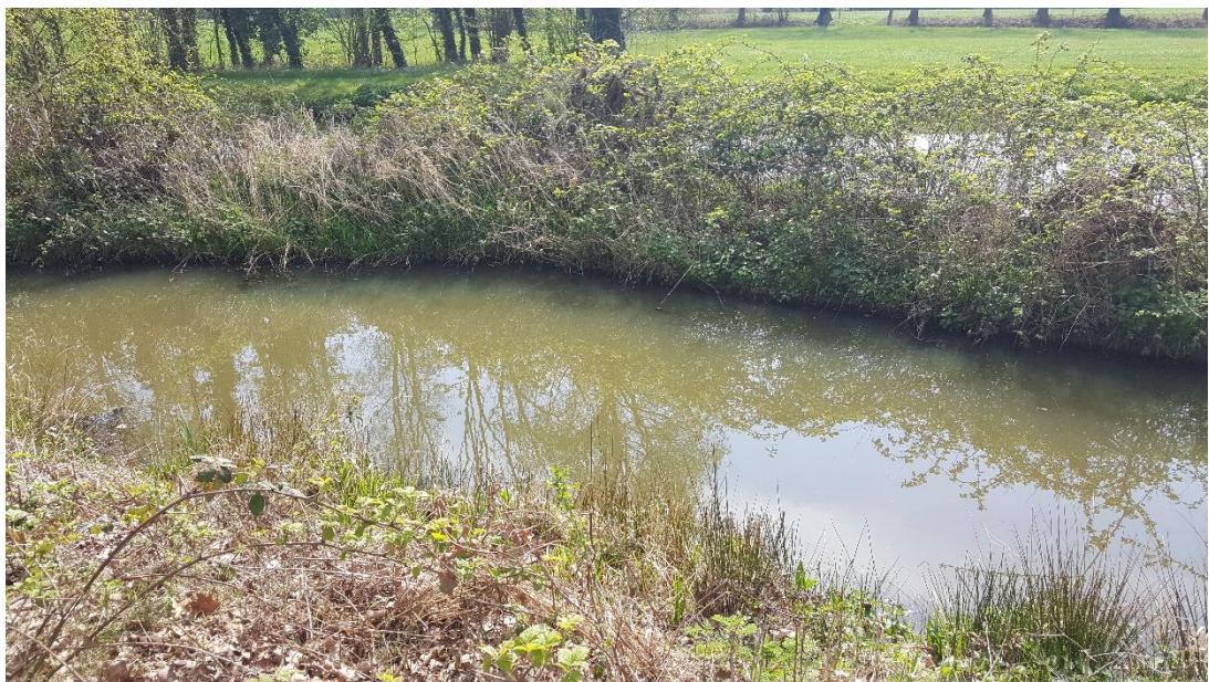
Figuur 2: Foto locatie tijdens veldbezoek op 9 april 2019.