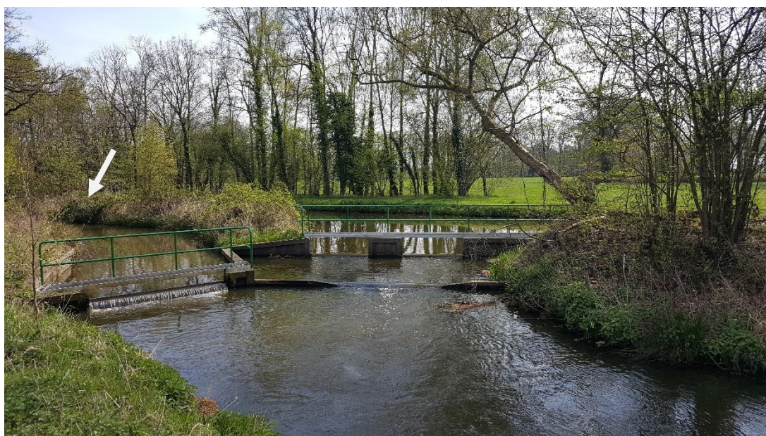
Figuur 5: Foto locatie tijdens veldbezoek op 9 april 2019.