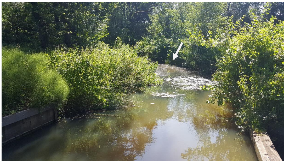
Figuur 4: Foto locatie tijdens veldbezoek op 27 juni 2019.