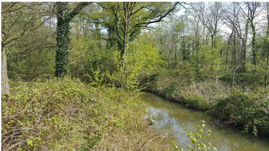
Figuur 3: Foto locatie tijdens veldbezoek op 9 april 2019.